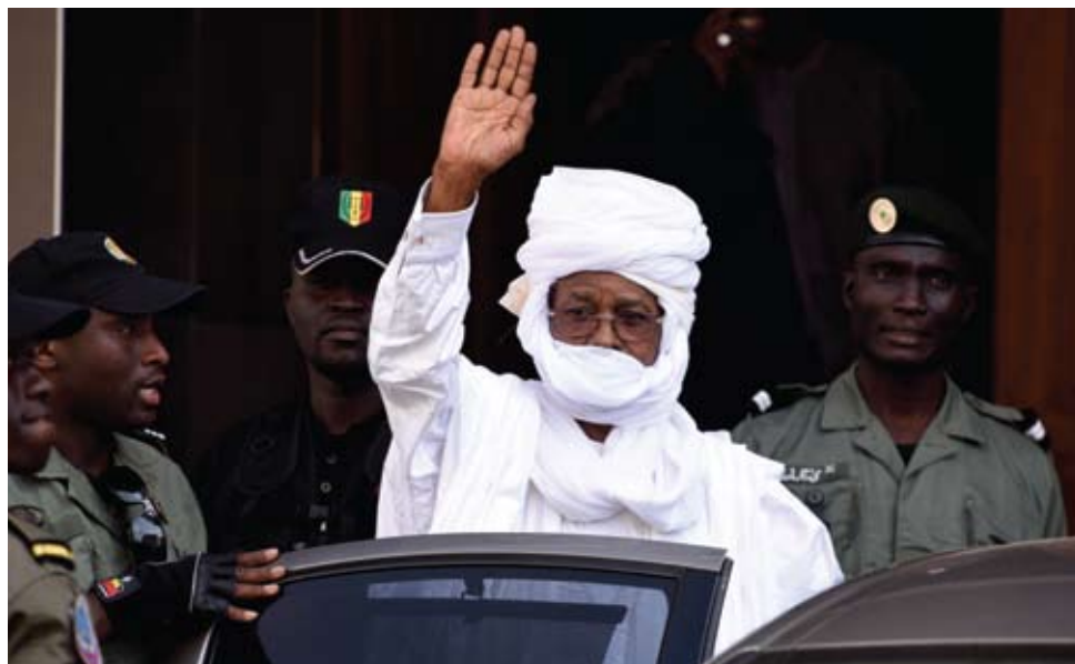
L'ancien président tchadien, Hissène Habré, Dakar, Sénégal, 2015.

En parallèle, la Fondation Hironnelle travaille en Birmanie à l'ouverture d'un Media Center au sein du Parlement.