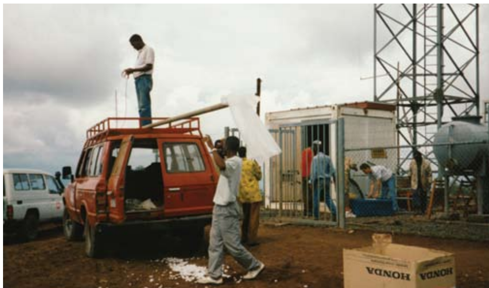
© Radio Agatashya, Rwanda 1995. Photo Fondation Hironnelle.

L'EI l'a bien compris, faisant des réseaux sociaux un des deux piliers de sa stratégie de communication : à l'attention des médias occidentaux, des vidéos professionnelles relayées par l'agence Amaq News ; à destination de la jeunesse occidentale à recruter, des fils Facebook ou Twitter mêlant images crues de la guerre et visions idylliques des territoires conquis. Au seul dernier trimestre 2014, le think tank états-unien Brookings Institution estimait à au moins 50 000 le nombre de comptes Twitter utilisés à des fins de propagande par l'EI. Depuis janvier 2015, l'organisation a toutefois pris conscience de la surveillance policière accrue sur les réseaux sociaux et demande à ses membres de les utiliser avec précaution.