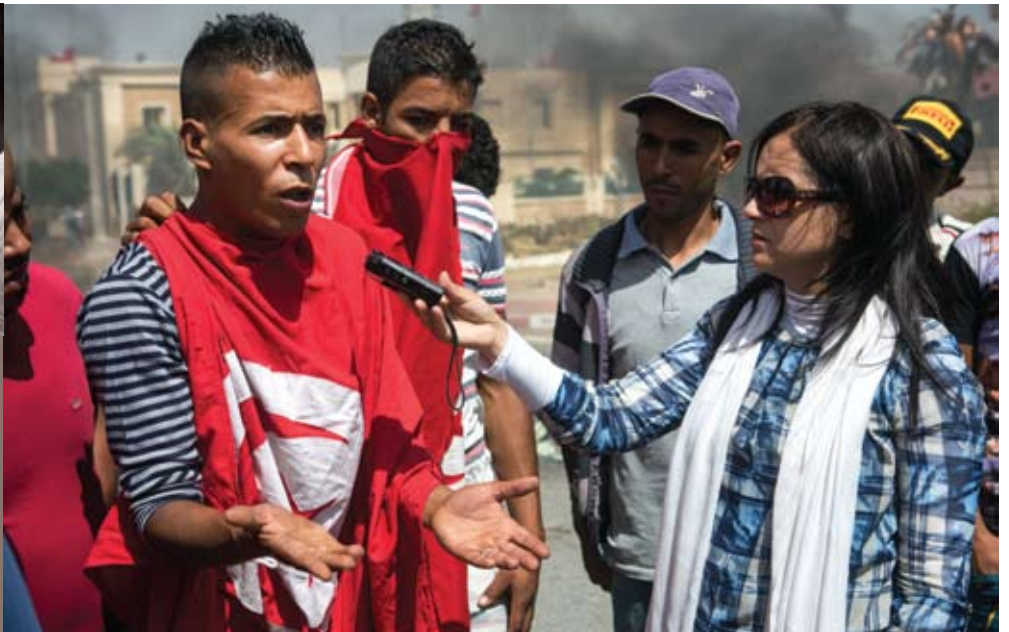
© Des manifestants tunisiens à Gafsa s'expliquent. Photo: Gwenn Dubourthoumiu / Fondation Hironnelle.

Jean-Marie Etter, Directeur général de la Fondation Hironnelle