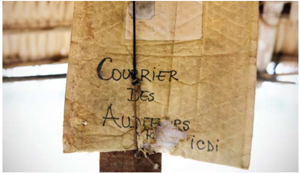
© La boîte aux lettres d'une radio communautaire centrafricaine pour ses auditeurs. Photo Sophie Brandström / Fondation Hironnelle.

Le droit d'être informé a un pendant, celui d'informer sans être inquiété. Des ONG veillent mondialement à la protection des journalistes et du droit à la liberté d'expression, parmi lesquelles le Committee to Protect Journalists (New York), Article 19 (Londres) ou Reporters sans frontières (Paris, Genève).