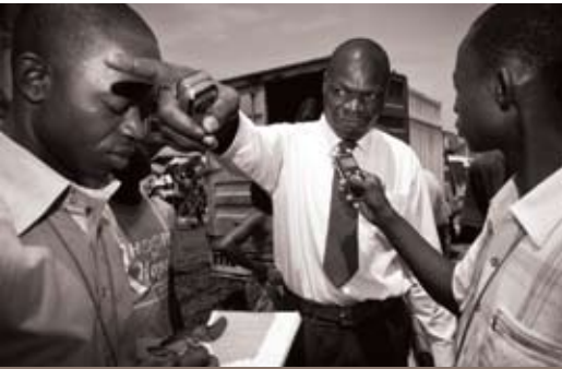
© Radio Okapi en reportage à Kinshasa. Photo: Gwenn Dubourthoumiu / Fondation Hironnelle 2011

NOUVELLES DE LA FONDATION HIRONDELLE | NUMÉRO SPÉCIAL 20 ANS | OCTOBRE 2015