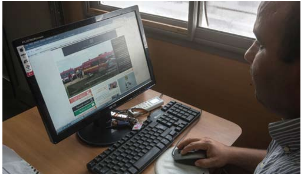
© Un journaliste de la Radio tunisienne sur le web. Photo Gwenn Dubourthoumieu / Fondation Hirondelle.

Dans le reste du monde, les pays en crise sont aussi les plus dépourvus d'accès au réseau : avec respectivement 11 et 17 utilisateurs pour 100 habitants, l'Iraq et la Libye sont deux fois moins connectés que leurs voisins. Les autres causes du faible accès à l'Internet sont connues : analphabétisme, régimes autoritaires méfiants à l'égard de la diffusion des informations, infrastructures insuffisantes, coût de l'équipement... Les effets économiques structurants de l'Internet plaident néanmoins pour un élargissement rapide des réseaux.