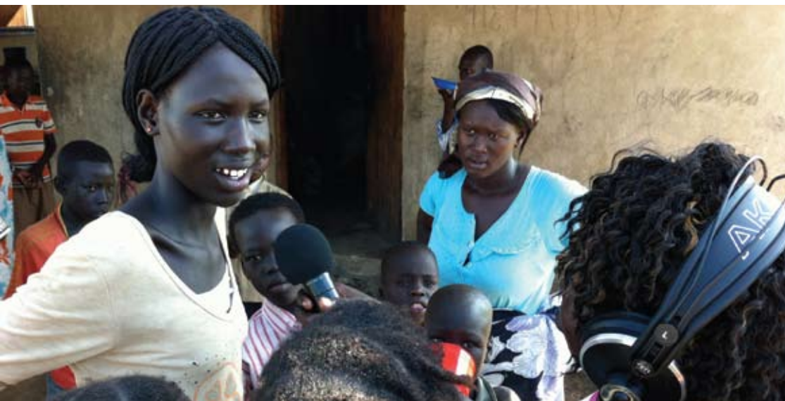
© Journaliste de Radio Miraya à Juba. Photo : Kevin Bellwood / Fondation Hirondelle