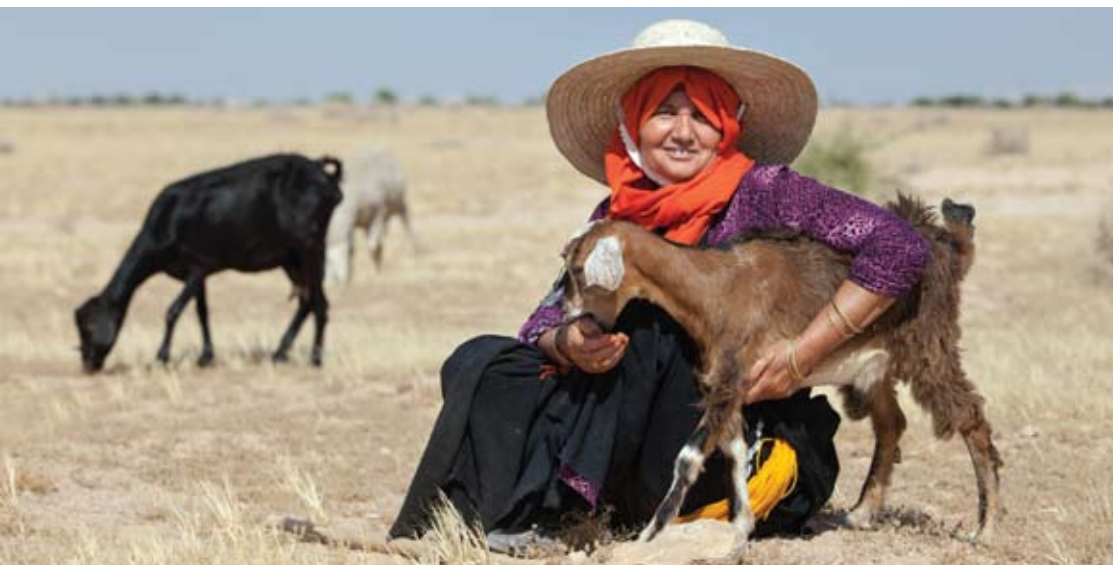
© Une paysanne et son chevreau, avant l'entretien avec un journaliste. Metlaoui, Tunisie. Photo Gwenn Dubourtoumieu / Fondation Hironnelle.

Une deuxième génération de l'appareil doit apparaître sur le marché dans les tout prochains mois.