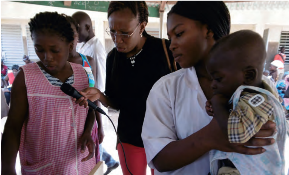
Une journaliste de la RTB en reportage pendant les élections de novembre 2015 au Burkina Faso.