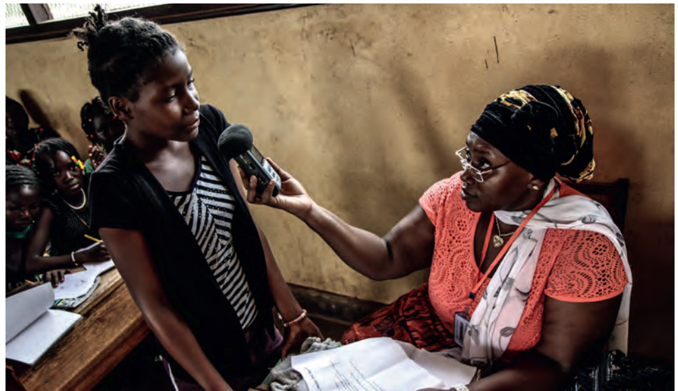
Journaliste de Radio Ndeke Luka en reportage dans une école à Bangui.