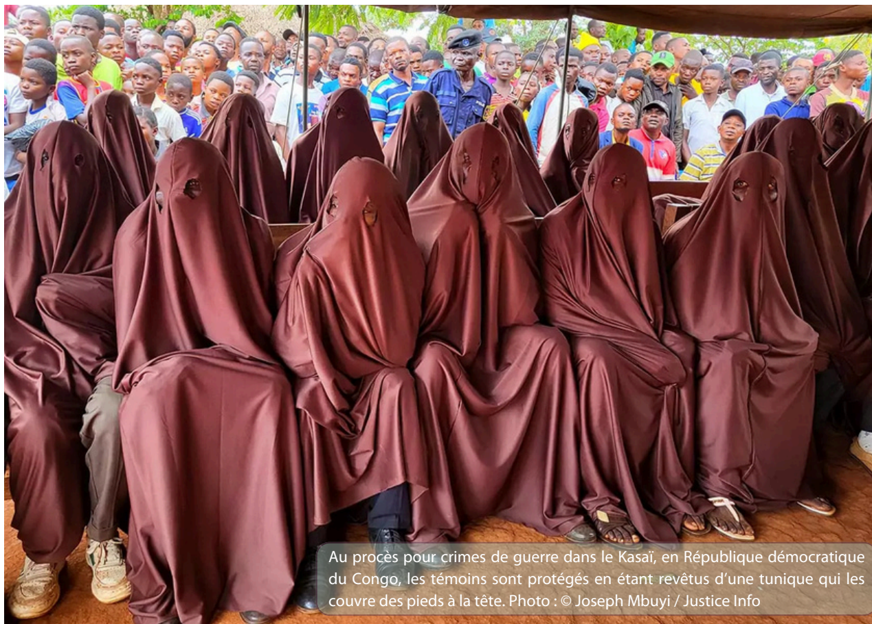
Au procès pour crimes de guerre dans le Kasai, en République démocratique du Congo, les témoins sont protégés en étant revêtus d'une tunique qui les couvre des pieds à la tête.