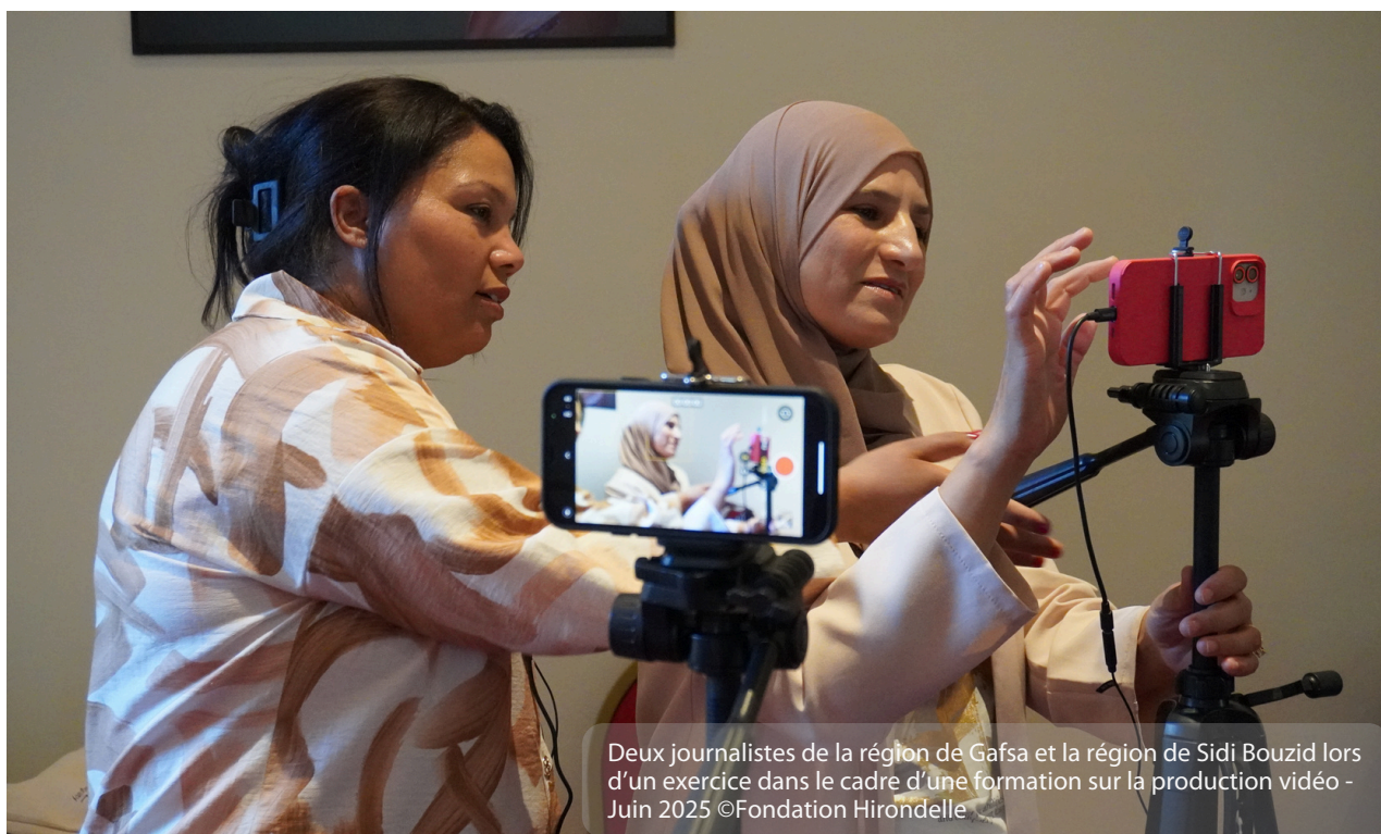
Deux journalistes de la région de Gafsa et la région de Sidi Bouzid lors d'un exercice dans le cadre d'une formation sur la production vidéo - Juin 2025