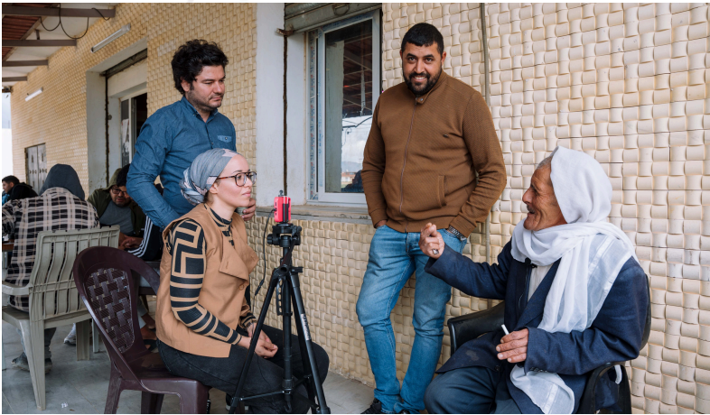
Photo : les journalistes de Radio Sufetula de la région de Sbeitla dans le gouvernorat de Kasserine réalisent un reportage sur les préoccupations des habitant-es. Octobre 2025 ©Fondation Hirondelle

La pérennisation de l'action des acteurs de la société civile et des médias à l'échelle locale est l'une des conditions essentielles à l'avènement d'une gouvernance locale démocratique, inclusive et responsable. Dans cette optique, la Fondation Hirondelle, aux côtés de NIRAS, poursuit le soutien aux initiatives citoyennes ainsi que celles de la société civile, des communes et des autorités locales dans les six gouvernorats concernés. En parallèle, la Fondation élargit son action dans trois nouveaux gouvernorats, notamment pour appuyer une couverture éthique des mobilités humaines, renforçant la cohésion sociale. Le programme de renforcement des capacités s'adresse aux communautés afin de renforcer leurs compétences pour mieux communiquer sur les problématiques qui les concernent. Il cible également les médias et les journalistes, notamment à travers des formations en journalisme mobile, en investigation et sur le traitement responsable de ces enjeux sensibles. La présence numérique est renforcée grâce au développement et à la production de formats vidéo.