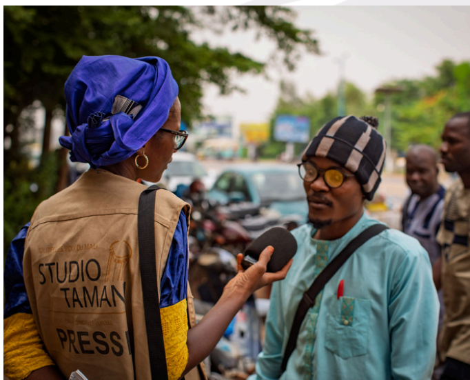
Une journaliste reporter pour Studio Tamani recueille l'avis des citoyen-nes sur la suspension des partis politiques au Mali dans le cadre d'un micro-trottoir.

Avec un nombre réduit de radios partenaires, et une pénétration croissante des réseaux sociaux au Mali, le Studio Tamani continuera à améliorer sa présence en ligne. Le site internet sera revu, avec une meilleure intégration des contenus audio et numériques sur les réseaux sociaux.