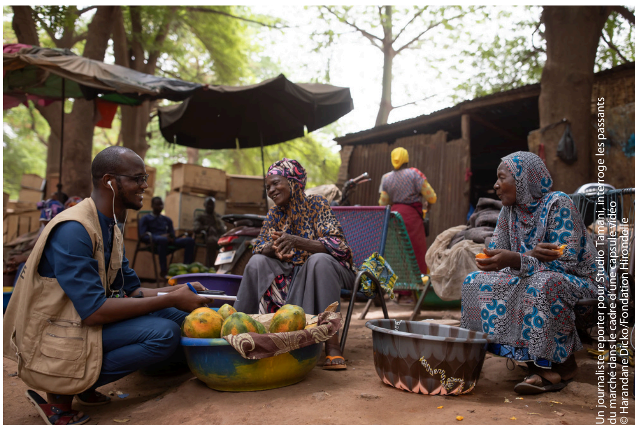
Un journaliste reporter pour Studio Tamani, interroge les passants du marché dans le cadre d'une capsule vidéo