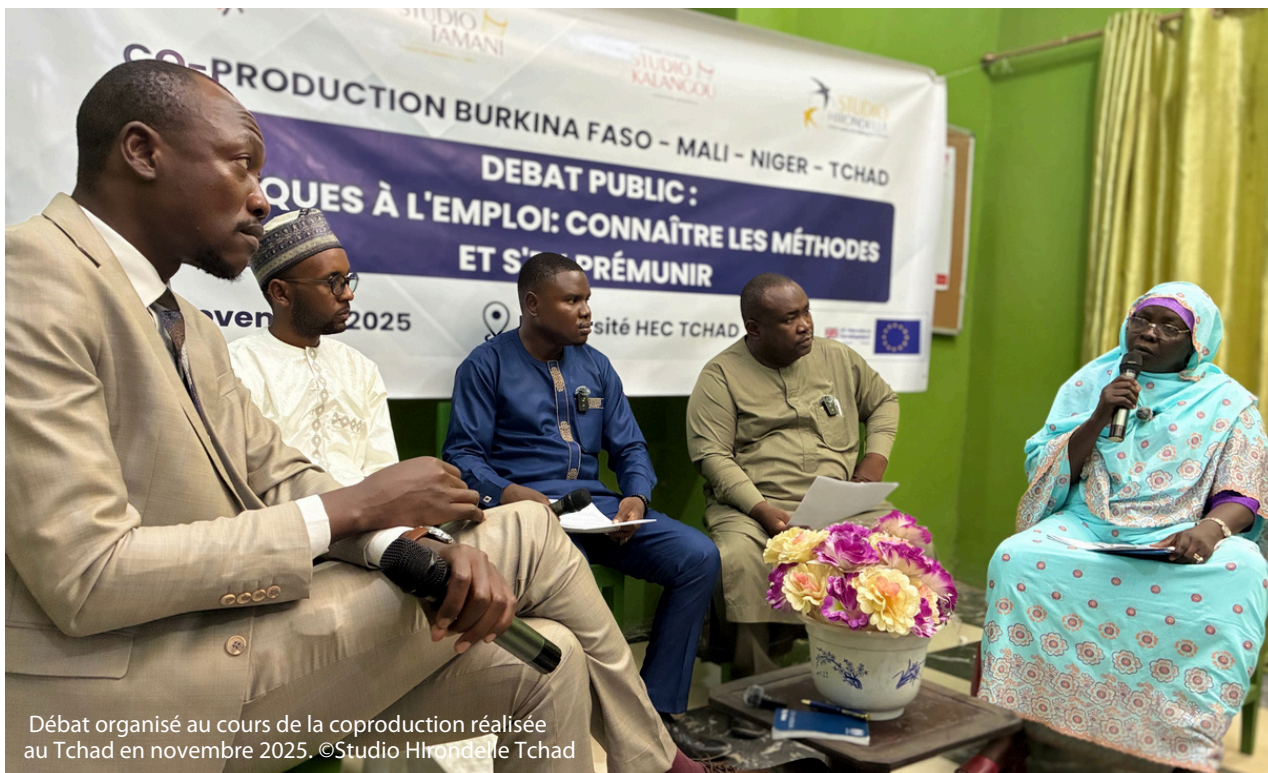
Débat organisé au cours de la coproduction réalisée au Tchad en novembre 2025.