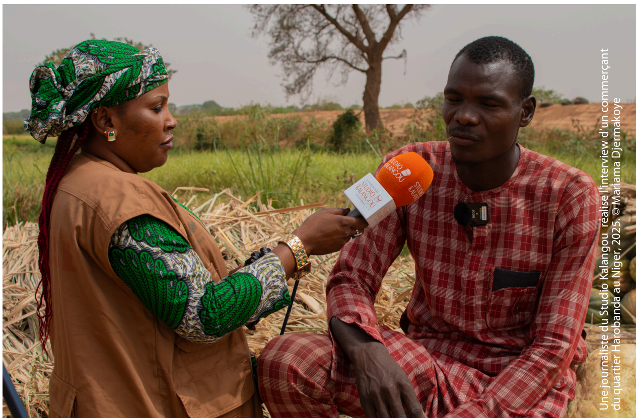
Une journaliste du Studio Kalangou réalise l'interview d'un commerçant du quartier Harobanda au Niger, 2025.

Depuis 2022, Studio Kalangou est certifié Journalism Trust Initiative.